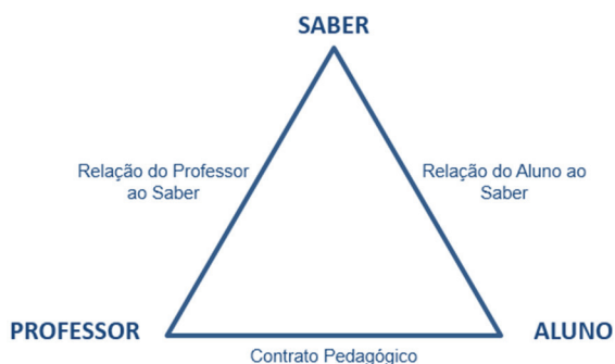
Figura 1: Triângulo das Situações Didáticas.

do que propõe Brousseau (1986), podem ser organizados em disposição triangular, estabelecendo o triângulo das Situações Didáticas, apresentado na Figura 1.