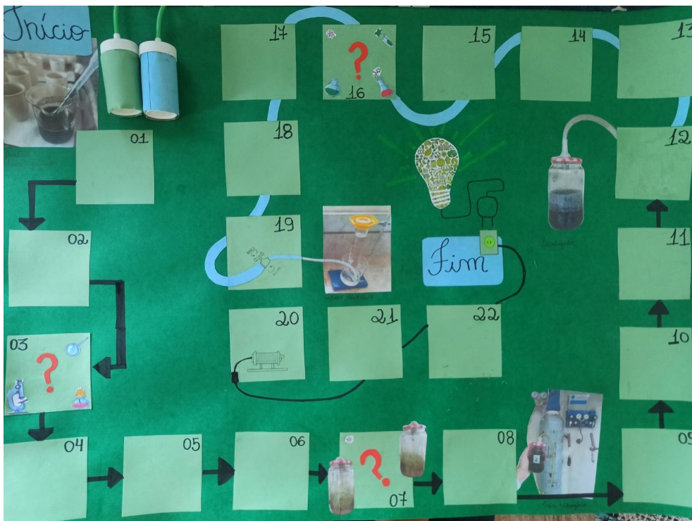
Figura 1: Tabuleiro de mesa para o jogo Perfil Sustentável.