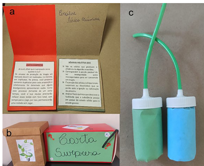
Figura 2: Imagens do jogo didático. (a) Cartas para o Perfil Sustentável; (b) Caixas para o armazenamento; (c) Peões em forma de biodigestores.

conta-gotas, onde foi inserido um pedaço de fio de energia na extremidade superior dos mesmos, a fim de representar a mangueira que conduz o biogás até o gasômetro (Figura 2c).