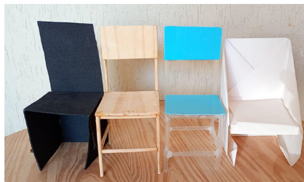
Figura 2: Miniaturas de cadeiras feitas com EVA, madeira, plástico e papel.

Além do comportamento distinto em contato com o calor, materiais diferentes também podem se distinguir em outras propriedades, como resistência, elasticidade e compressibilidade. Essas características implicam em comportamentos diversos dos materiais. Este fator foi considerado para explorar as cenas em que Cachinhos Dourados passa pela sala de estar, experimentando as cadeiras, e pelo quarto, testando os colchões.