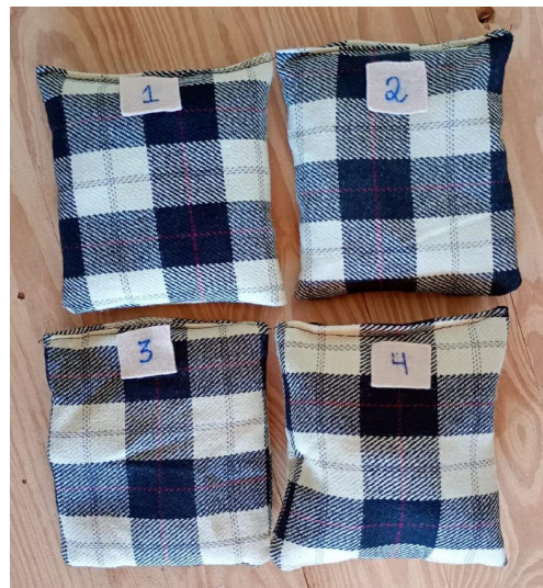
Figura 3: Colchões com diferentes enchimentos, identificados pelos números de 1 a 4.

continuação da história é que ela faça parte de uma aula de ciências por investigação. As perguntas propostas no texto servem como momentos em que as crianças realizam investigações com os materiais, elaborando hipóteses e compartilhando suas conclusões. A história proposta contextualiza questionamentos para atividades investigativas que possam conduzir as crianças no processo de construção das ideias sobre calor, temperatura e propriedades dos materiais. Além das perguntas inseridas no próprio reconto, os trechos oferecem diferentes possibilidades de exploração. Por exemplo, na parte sobre as cadeiras, as crianças podem receber miniaturas de ursos construídos com materiais acessíveis para avaliar quais seriam ideais para um urso mais leve e um mais pesado (Figura 4).