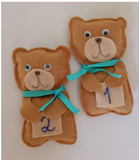
Figura 4: Ursos feitos em feltro com diferentes preenchimentos: o 1 (leve) está com algodão e o 2 (pesado), está com pedrinhas.