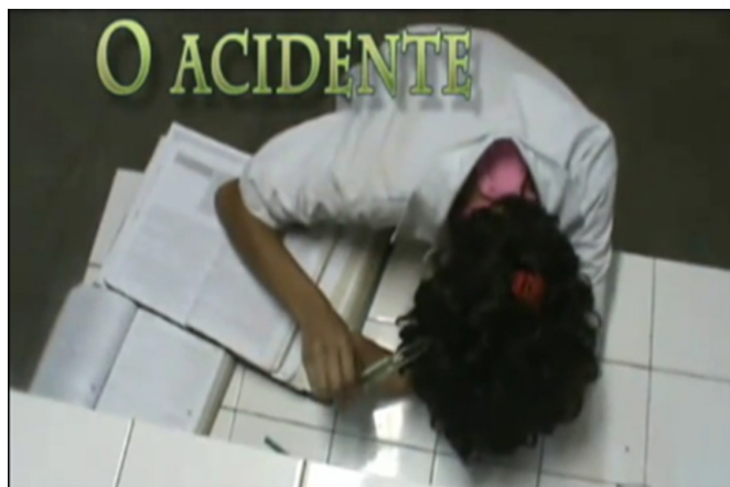
Figura 2. Fotograma de vídeo produzido no segundo semestre do ano de 2010 mostrando acidente de trabalho originário de falta de padronização e descumprimento das BPF na indústria de cosméticos.