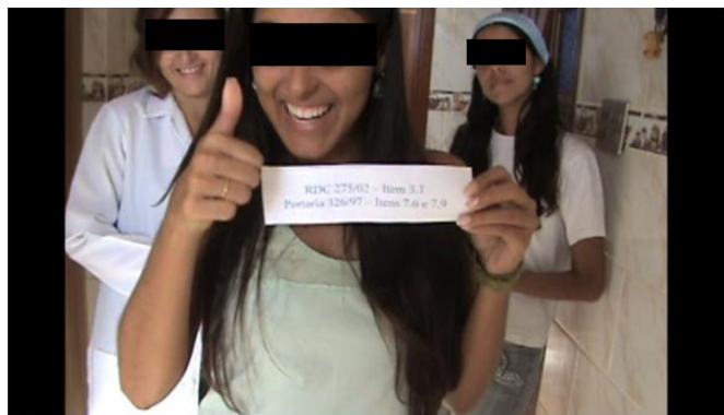
Figura 3. Fotograma de vídeo produzido e apresentado no primeiro semestre de 2009, mostrando a rotina de uma panificadora que não cumpria as BPF para alimentos.