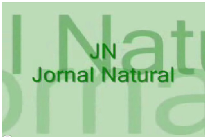
Figura 1. Fotograma de vídeo sobre BPF para farmácia de manipulação apresentado no primeiro semestre de 2008 na forma mista de encenação teatral e vídeo. Foi produzido o Jornal Natural para mostrar uma denúncia de uma indústria de cosméticos que havia cometido infrações sanitárias.

Aluno B: “A disciplina durante o semestre se mostrou muito atrativa durante a apresentação das atividades (estratégias de ensino). Pelo fato de ser uma disciplina baseada em leis e regulamentos com os quais os alunos