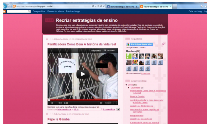
Figura 5. Visão do blog Recriar estratégias de ensino ( http://recriarestrategias.blogspot.com ).

O blog Recriar estratégias de ensino para divulgar roteiros de práticas pedagógicas e estratégias de ensino já havia sido desenvolvido pela professora ao longo do seu mestrado profissional em Ensino de Biociências e Saúde (IOC-FIOCRUZ). Foi sugerido, então, que os alunos compartilhassem seus vídeos postados no YouTube no blog. A Figura 5 mostra a aparência do blog.