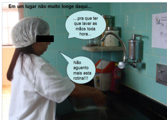
Figura 4. Fotograma de vídeo produzido e apresentado no segundo semestre de 2010, mostrando o funcionamento de uma indústria alimentícia que não cumpria as BPF.

não estão muito familiarizados, já que normalmente estão vendo a matéria pela primeira vez, pode se tornar um pouco cansativo e as atividades acabam facilitando o aprendizado e o tornando mais agradável.”