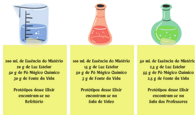
Figura 1: Exemplo de desafio - O Segredo das Soluções: a fórmula do Elixir (versão para a 1ª Série).

“trapacear” na resolução do QC, o que foi evitado pela intervenção dos mediadores. Para aprimoramento da atividade, sugere-se que a ordem alfabética não seja mantida e que as laterais das letras não estejam todas na peça da letra, e que as laterais só se revelem com os QC’s montados corretamente.