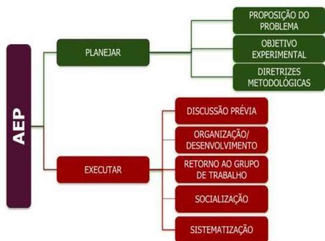
Figure 2. Esquema dos eixos estruturantes da AEP.

síntese, observa-se na Figura 2, os fundamentos estruturantes da AEP, tratados como eixo teórico (o planejar) e eixo metodológico (o executar).