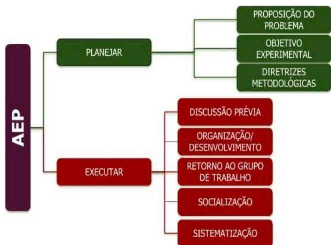
Figure 2. Esquema dos eixos estruturantes da AEP.

síntese, observa-se na Figura 2, os fundamentos estruturantes da AEP, tratados como eixo teórico (o planejar) e eixo metodológico (o executar).