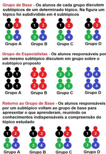
Figure 1. Representação esquemática de atividade baseada no método cooperativo de aprendizagem Jigsaw (adaptado de Fatarelli et al. , 2010).

todo o conhecimento indispensável para a compreensão do conteúdo. Cada estudante precisa aprender a matéria para si e explicar a seus colegas, de forma clara, o que aprendeu (Fatarelli et al. , 2010; Cochito, 2004).