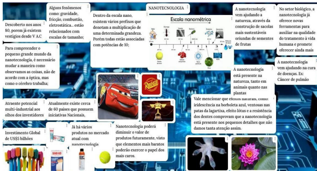
Figure 4. Mural produzido pela E01 sobre o conteúdo de nanotecnologia.